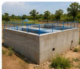
Réservoir au sol