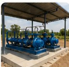
Station de pompe